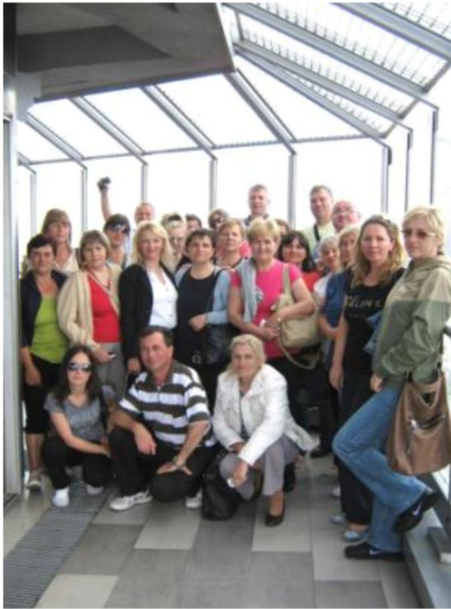
УЧЕСНИЦИ ЕКСКУРЗИЈЕ НА „ВИСИНИ“ ЗАДАТКА ( око 100 метара изнад тла )

Наставници и остали радници школе су 2. јула 2014. године отишли на традиционалну наставничку екскурзију. Релација је била: Кучево, Авалски торањ, Храм светог Саве на Врачару, Бранковина и ноћење у Ваљево. Сутрадан смо обишли Дивчибаре где смо и ручали, а потом смо кренули ка Кучеву.