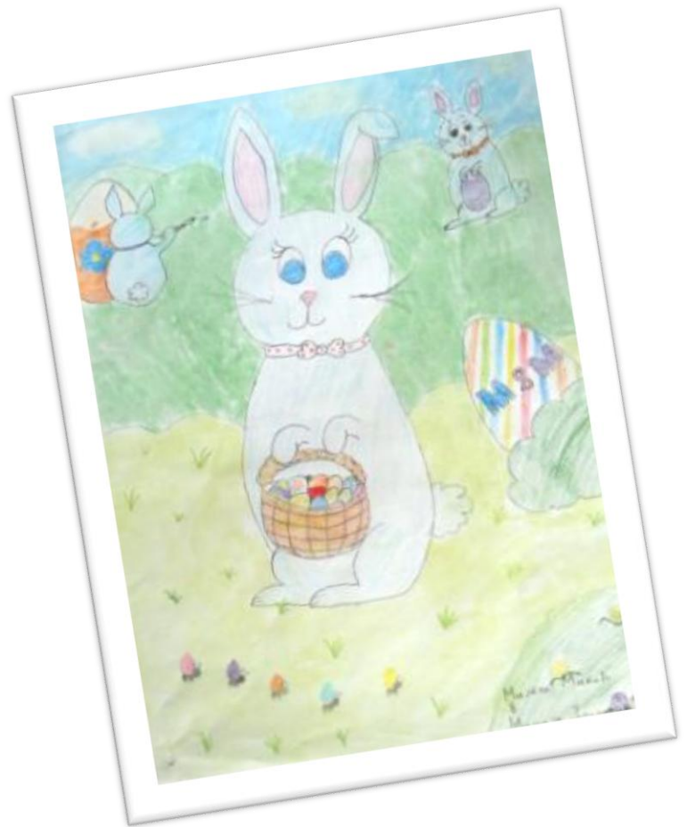
ЛИКОВНИ РАДОВИ УЧЕНИКА ПЕТОГ РАЗРЕДА – УСКРШЊЕ ЧАРОЛИЈЕ