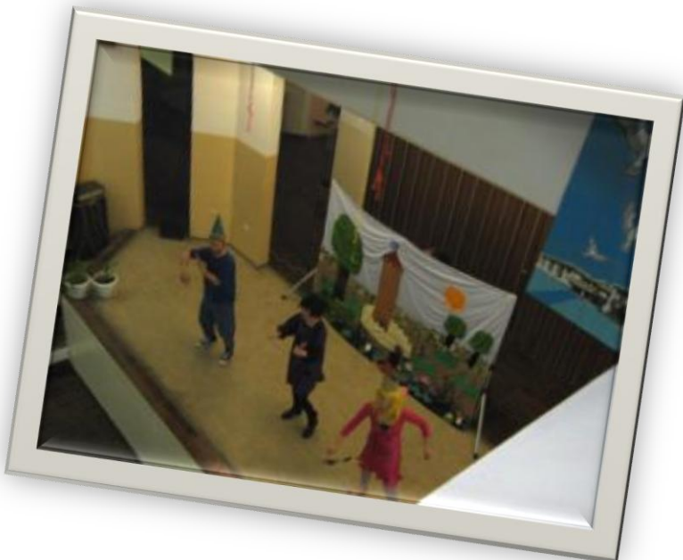
ПОЗОРИШНА ПРЕДСТАВА У ШКОЛИ