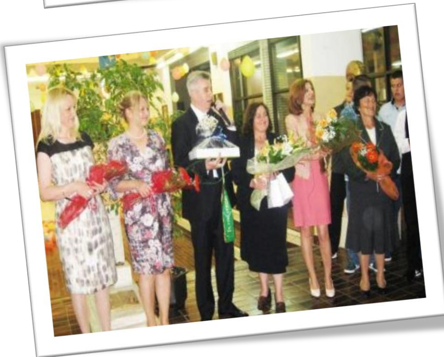
СА ПРОСЛАВЕ МАТУРЕ