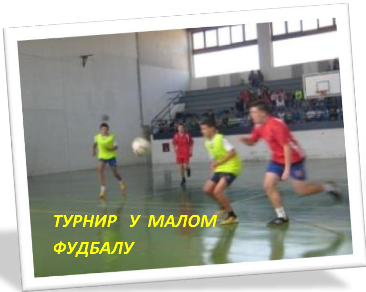
ТУРНИР У МАЛОМ ФУДБАЛУ