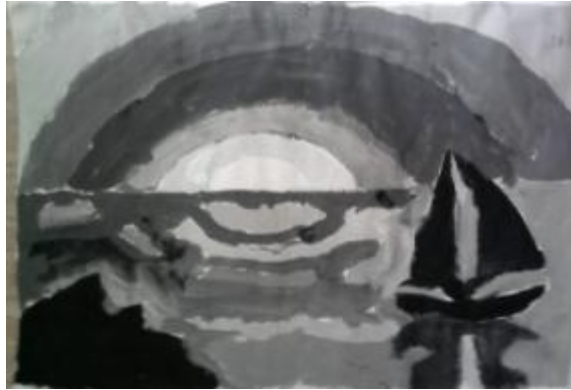
ФОТОГРАФИЈЕ УЧЕНИКА СЕДМОГ РАЗРЕДА