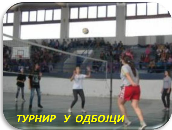
ТУРНИР У ОДБОЈЦИ