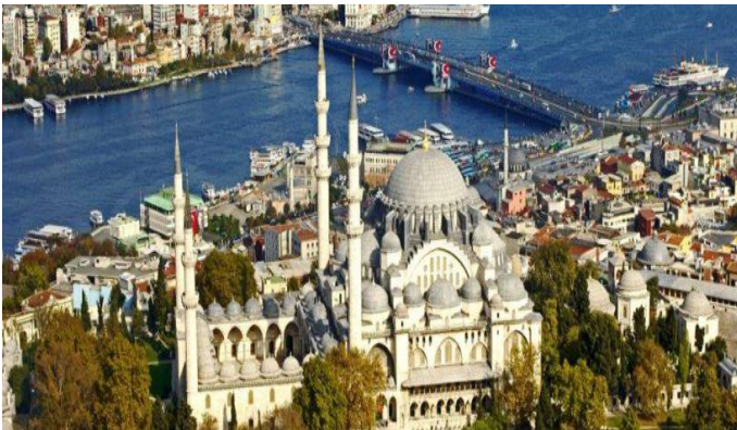
Сулејманова џамија у Истамбула

Грађевине су украшавали мотивима биљака и геометријских облика. Те шаре се зову арабеске .