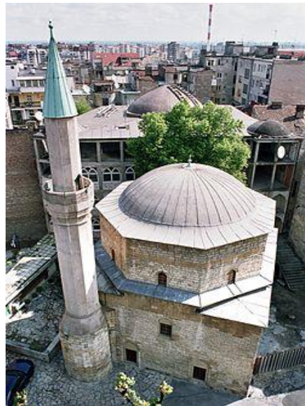
Цамија у Београду