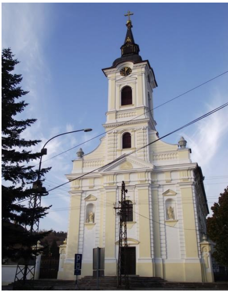
Катедрала у Зрењанину