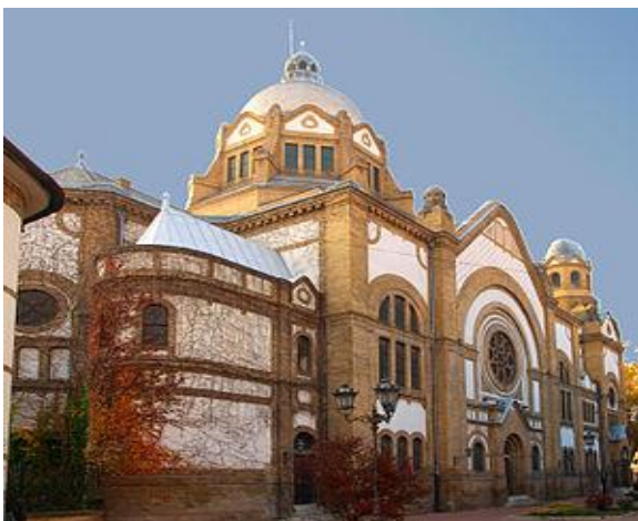
Синагога у Новом Саду